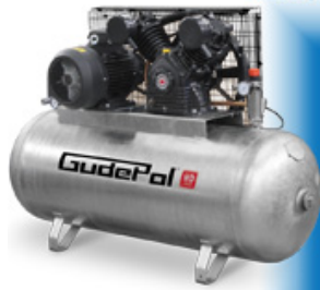
kompresor tłokowy HD